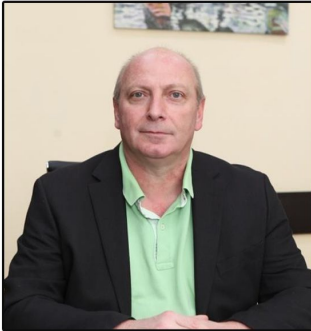
პროფესორი ოთარ ბრეგაძე