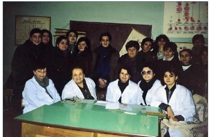
1990-2000 წწ. — კლინიკო-ლაბორატორიული დიაგნოსტიკის კათედრა