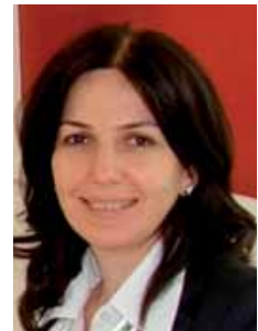
ნუნუ მიცვევიჩი ვიცე-პრეზიდენტი