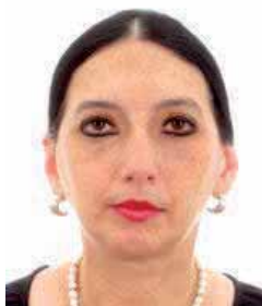
მაია გოთუა ვიცე-პრეზიდენტი