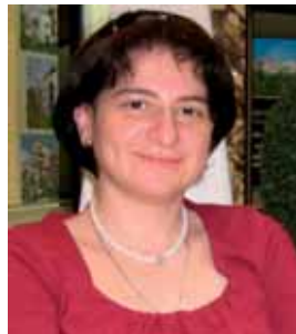
ია ფანცულაია ვიცე-პრეზიდენტი