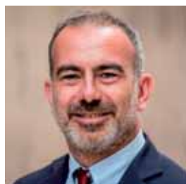
სტეფანო დელ ჯაკო

პრეზიდენტი, საქართველოს მეცნიერებათა ეროვნული აკადემია