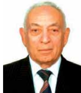
ნოდარ გოგებაშვილი საპატიო პრეზიდენტი