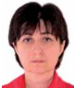
თინათინ ჩიქოვანი ყოფილი პრეზიდენტი