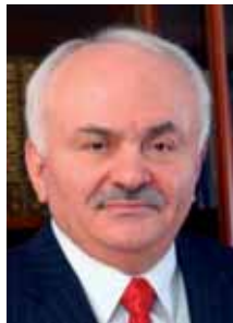
რევაზ სეფიაშვილი პრეზიდენტი